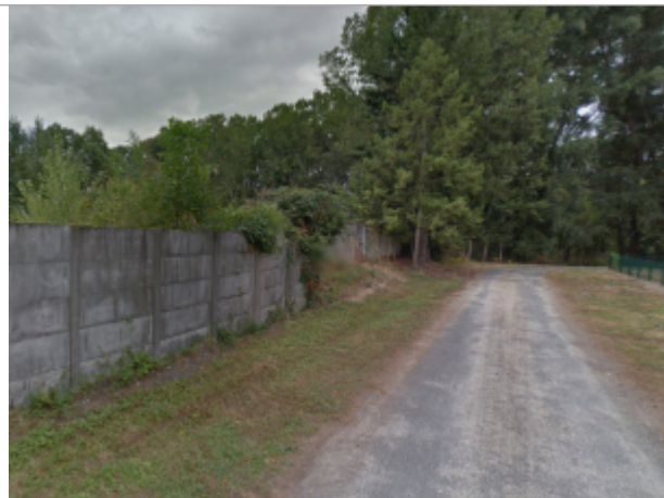
Site en 2012

Coordonnées WGS84 : X: 1.72870300 / Y: 47.35075900