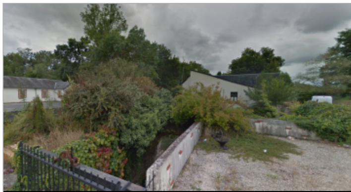
Site en 2012

Coordonnées WGS84 : X: 1.72846400 / Y: 47.34971100