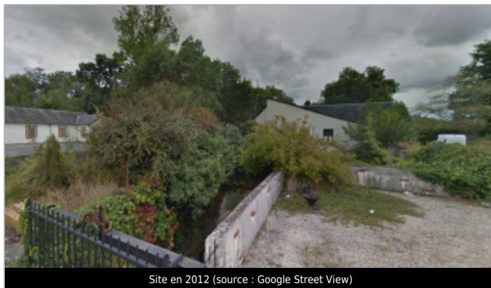
Site en 2012