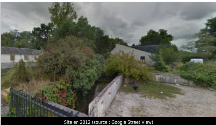
Site en 2012

GÉOLOCALISATION Coordonnées WGS84 : X: 1.72846400 / Y: 47.34971100 Coordonnées RGF93 (Lambert 93) X: 604010.1 / Y: 6695148.31 Coordonnées RGF93 (ETRS89) : X: 1.728464 / Y: 47.349711 Code Hydro: K6--0250 Rive de référence: Droite