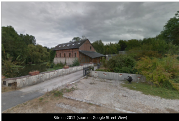
Site en 2012

GÉOLOCALISATION Coordonnées WGS84 : X: 1.72849800 / Y: 47.35003900 Coordonnées RGF93 (Lambert 93) X: 604013.25 / Y: 6695184.7 Coordonnées RGF93 (ETRS89) : X: 1.728498 / Y: 47.350039 Code Hydro: K6-0250 Rive de référence: Droite