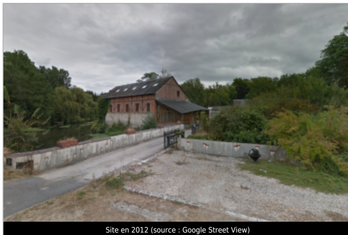
Site en 2012