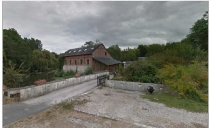
Site en 2012