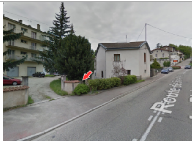
Vue du site, en 2013