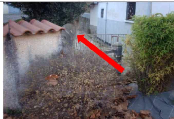
Vue du repère en 2009