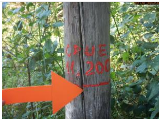
Vue du repère en 2023

Type de repérage : Campagne de terrain post-inondation