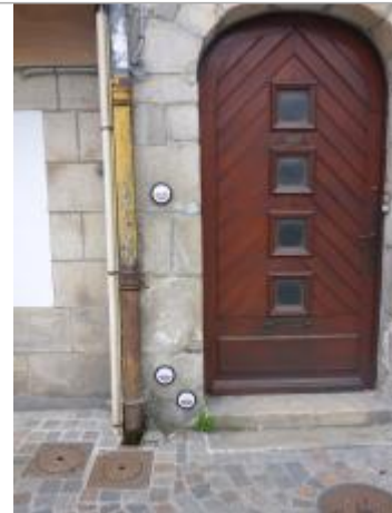
6, place Terre-au-Duc