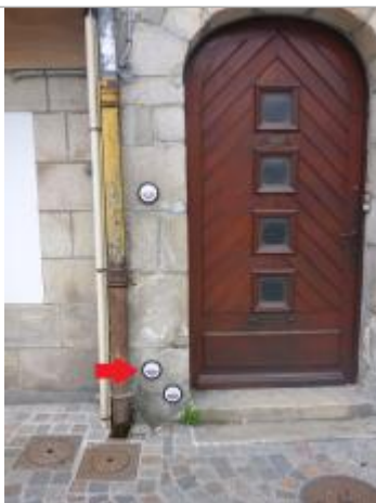
6, place Terre-au-Duc - Février 1974

Altitude calculée de l'eau (en m) : 3.97 m