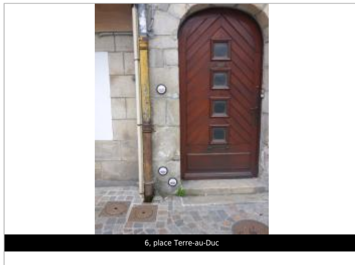
6, place Terre-au-Duc