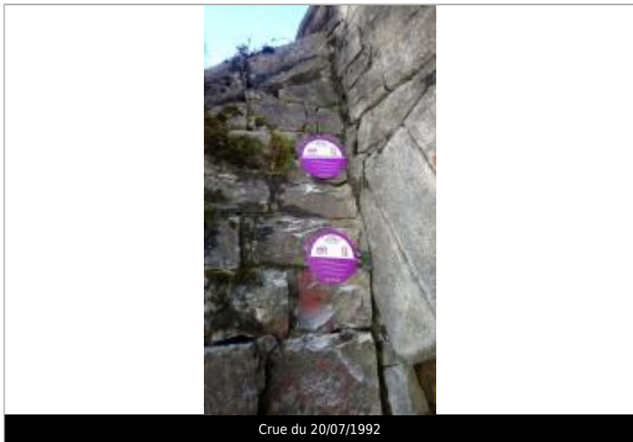
Crue du 20/07/1992

Texte : Crue du Verney 20/07/1992 Maximum de l'inondation : Non Visibilité : Oui État du repère : Bon Pérennité : Longue