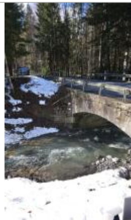
Pont du Verney