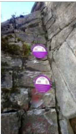
Crue du 20/07/1992