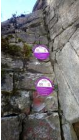
Crue du 04/01/2018