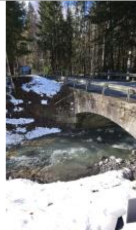
Pont du Verney