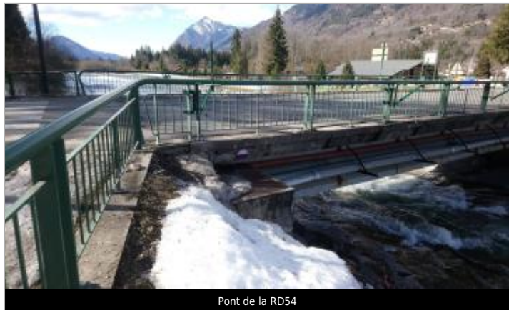
Pont de la RD54