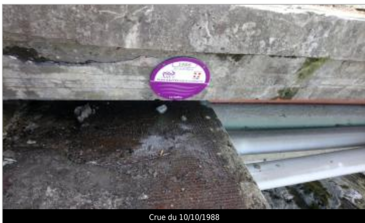
Crue du 10/10/1988

Texte : Crue du Giffre du 10/10/1988 Maximum de l'inondation : Oui Visibilité : Oui État du repère : Bon Pérennité : Longue