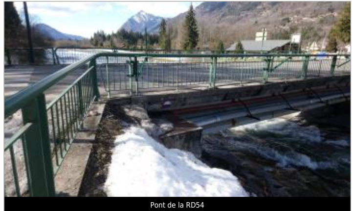
Pont de la RD54