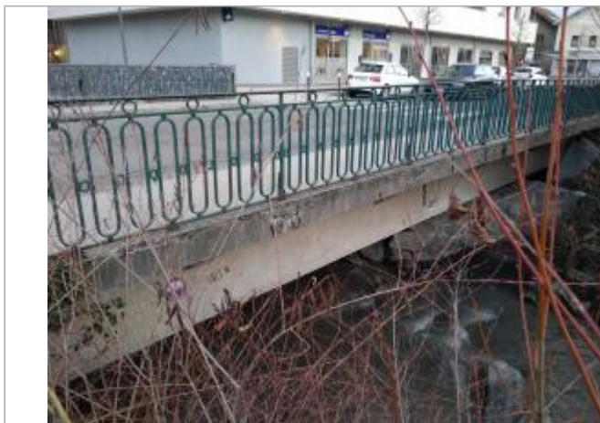
Pont de Boccard