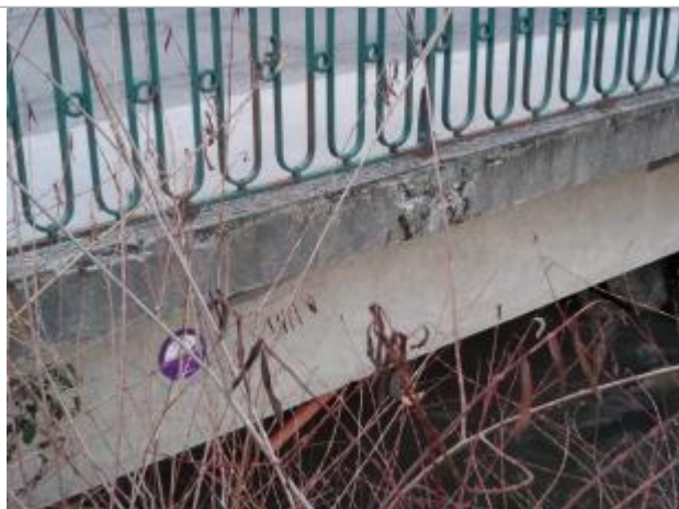
Crue du 22/09/1968