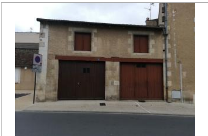
Repère vue de loin

Texte : Crue de la Gartempe ... 4,95m ... le 06 janvier 1982 Maximum de l'inondation : Oui Visibilité : Oui État du repère : Bon