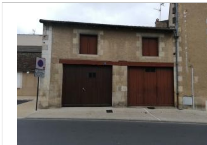
Repère vue de loin