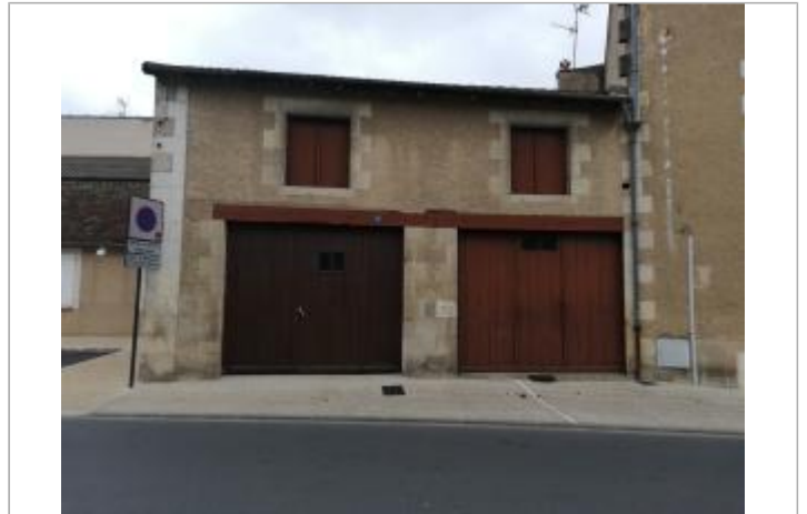
Site - Bd Gambetta