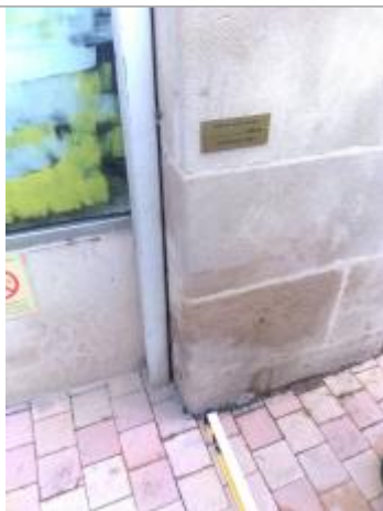
Vue de la laisse - Auteur : SPC LACI