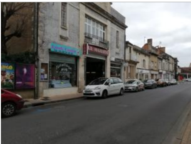
Repère vue de loin