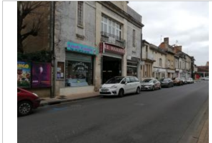
Site - Bd de Strasbourg

Coordonnées WGS84 : X: 0.87008305 / Y: 46.42495900