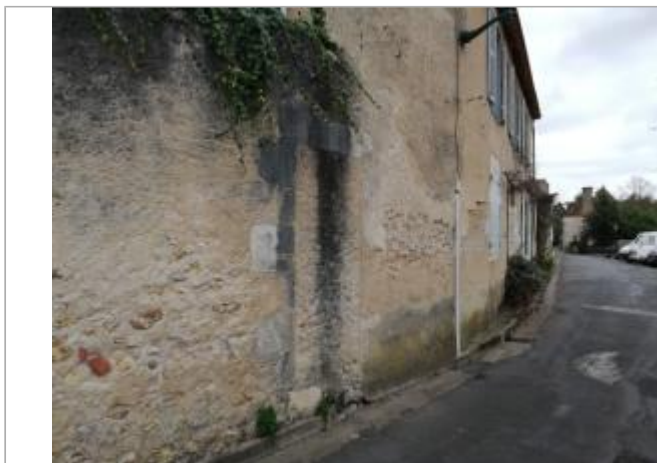
Site - rue du Puits Cornet