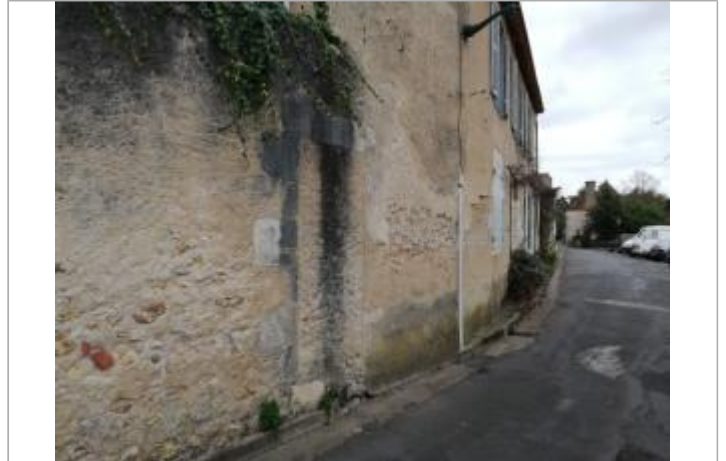
Site - rue du Puits Cornet