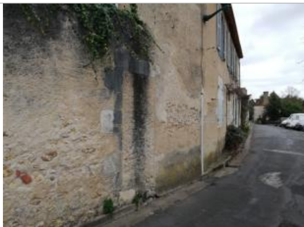
Repère vue de loin