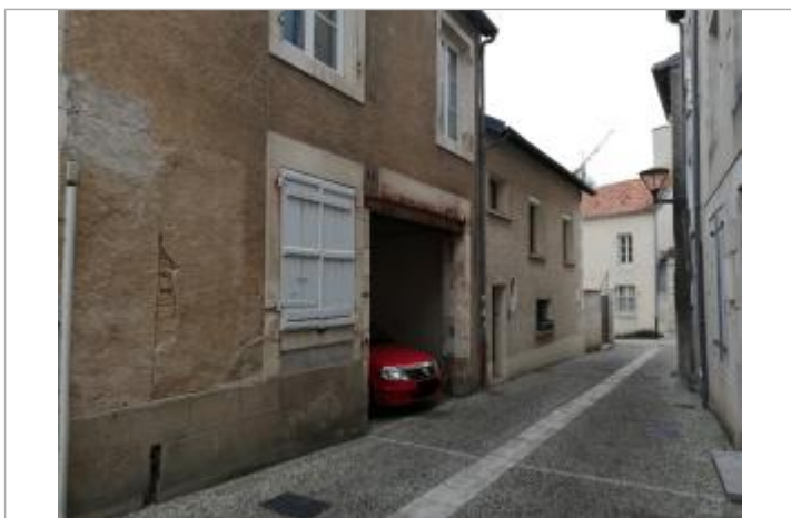
Repère vue de loin

Maximum de l'inondation : Oui Visibilité : Oui État du repère : Bon