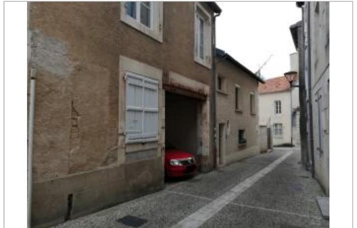
Site - rue du Palais