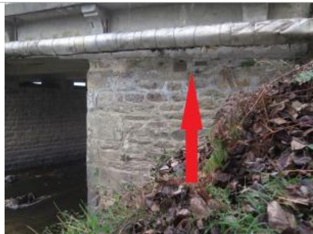
visite de contrôle le 17 octobre 2018 par le SPC VCB - photo des 2 plaques 1936 et 1966