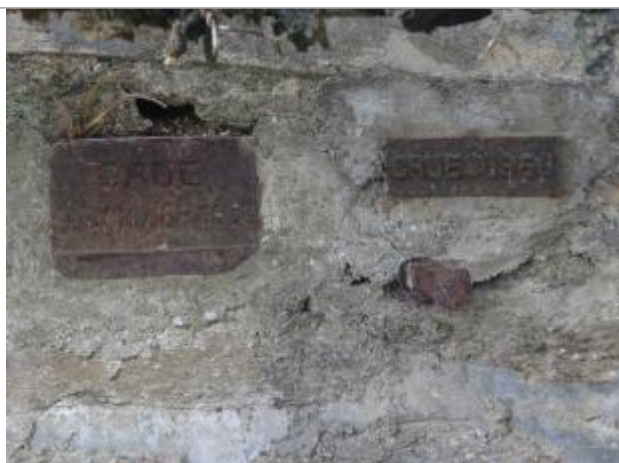
visite de contrôle le 17 octobre 2018 par le SPC VCB - photo des 2 plaques 1936 et 1966

Système altimétrique : NGF IGN 1969 (système normal)