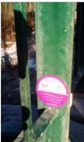
crue du 26/10/1892