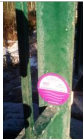
Pont de la RD907

Coordonnées RGF93 (ETRS89) : X: 6.6844992 / Y: 46.088857