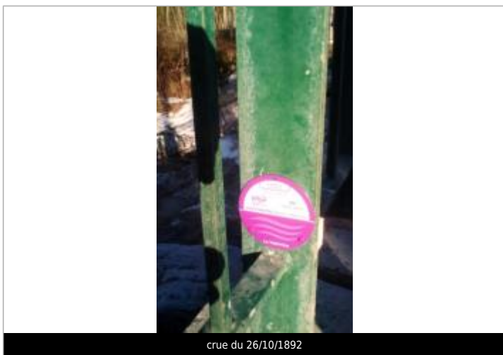
crue du 26/10/1892

Texte : crue de la Valentine du 26/10/1892 Maximum de l'inondation : Oui Visibilité : Oui État du repère : Bon Pérennité : Longue Repère calculé : Non PHEC : Oui