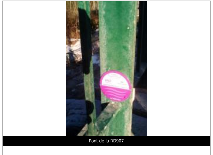
Pont de la RD907