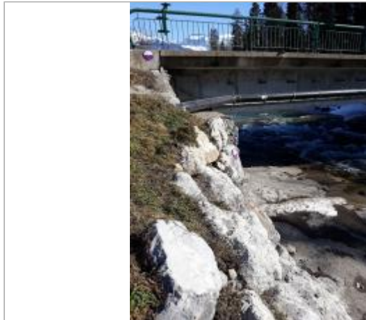
pont de la RD54