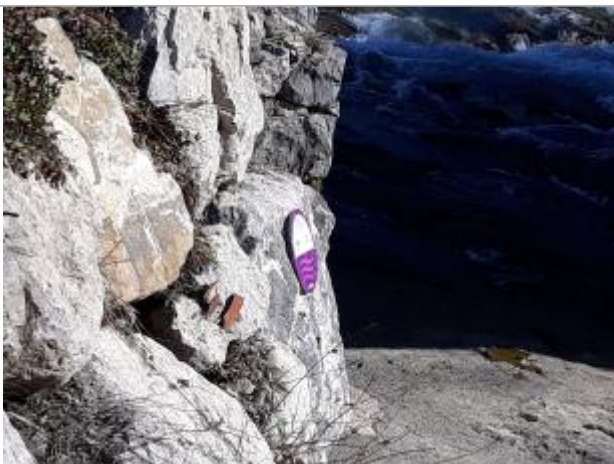
crue du 20/7/2007