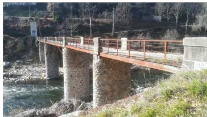
Photo du repère sur la face amont de la culée rive droite

Texte : Crue du 3 août 1963 - NGF 338.20