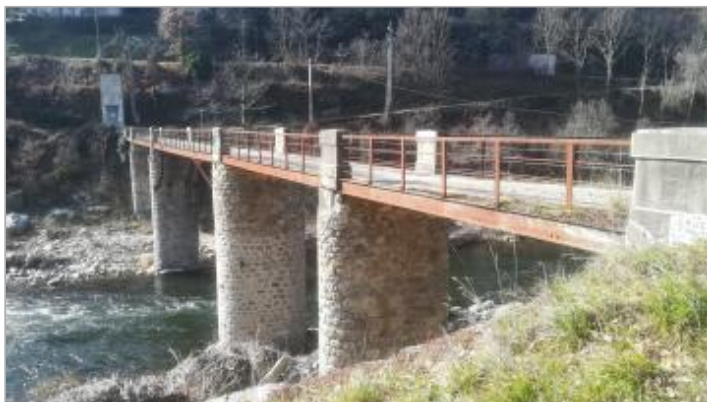
Photo de la passerelle de la Chaise