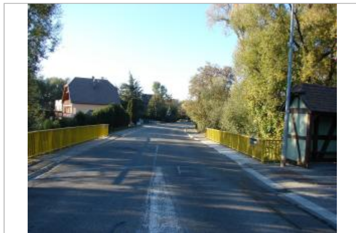
Vue général du site

GÉOLOCALISATION Coordonnées WGS84 : X: 7.11238120 / Y: 47.63711600 Coordonnées RGF93 (Lambert 93) X: 1008660 / Y: 6734342.94 Coordonnées RGF93 (ETRS89) : X: 7.1123812 / Y: 47.637116 Code Hydro: A11-0200 Rive de référence: