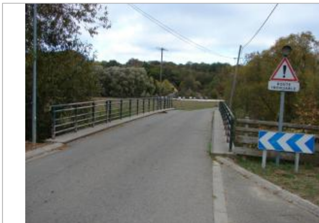
Vue général du site