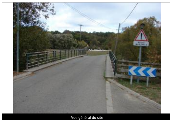
Vue général du site

GÉOLOCALISATION Coordonnées WGS84 : X: 7.11559870 / Y: 47.60865600 Coordonnées RGF93 (Lambert 93) X: 1009066 / Y: 6731197.96 Coordonnées RGF93 (ETRS89) : X: 7.1155987 / Y: 47.608656 Code Hydro : A11-0200 Rive de référence :