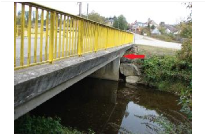
Vue général du site

GÉOLOCALISATION Coordonnées WGS84 : X: 7.12514370 / Y: 47.59040900 Coordonnées RGF93 (Lambert 93) X: 1009888 / Y: 6729210.95 Coordonnées RGF93 (ETRS89) : X: 7.1251437 / Y: 47.590409 Code Hydro: A11-0200 Rive de référence: