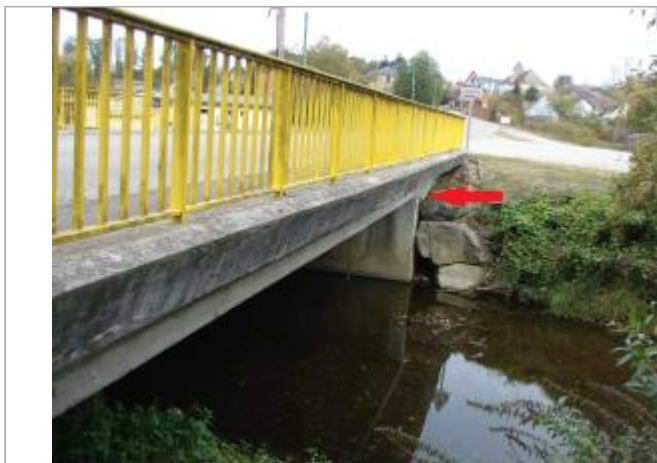
Vue général du site