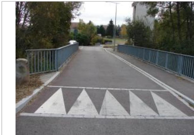
Vue général du site