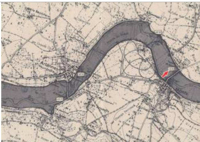
Localisation et altitude du repère (flèche rouge) sur le document d'origine