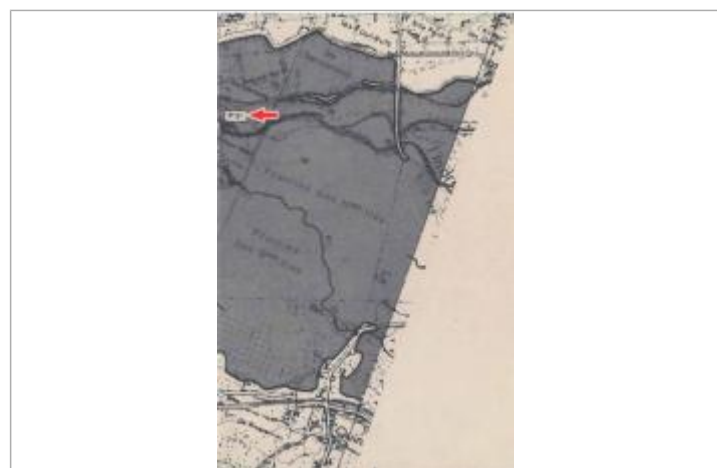
Localisation et altitude du repère (flèche rouge) sur le document d'origine

GÉNÉRAL Code : DDE37_jan82_R_4_1 Date de mise à jour : 12/02/2019 Auteur : SPC LCI