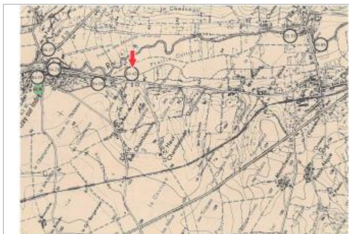
Localisation et altitude du repère (flèche rouge) sur le document d'origine