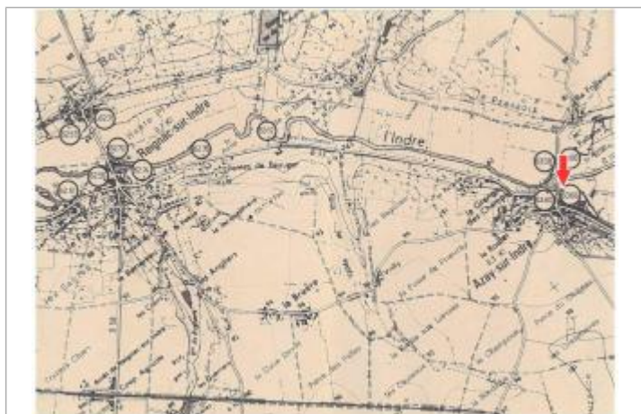
Localisation et altitude du repère (flèche rouge) sur le document d'origine

Code : DDE37_IND85_R_74_1 Date de mise à jour : 21/02/2019 Auteur : SPC LCI