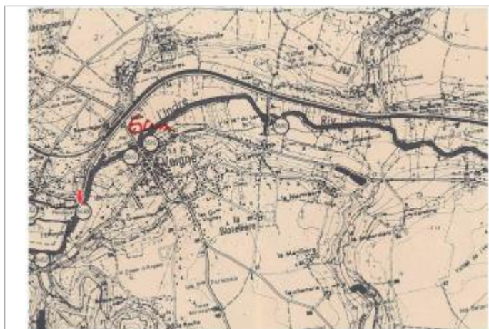
Localisation et altitude du repère (flèche rouge) sur le document d'origine