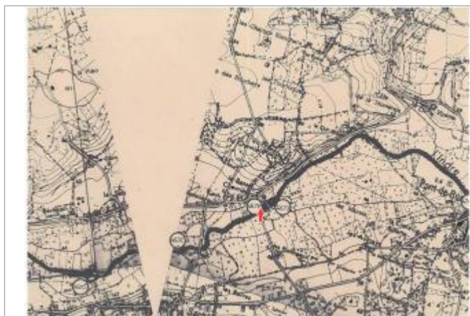
Localisation et altitude du repère (flèche rouge) sur le document d'origine