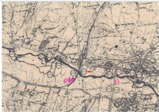
Localisation et altitude du repère (flèche rouge) sur le document d'origine