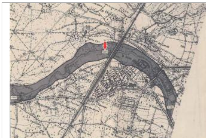
Localisation et altitude du repère (flèche rouge) sur le document d'origine