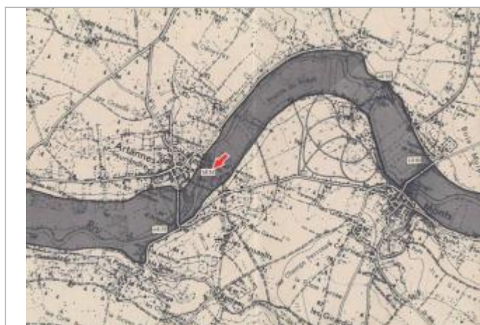
Localisation et altitude du repère (flèche rouge) sur le document d'origine