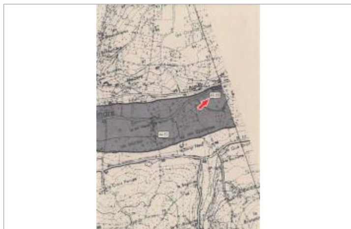
Localisation et altitude du repère (flèche rouge) sur le document d'origine