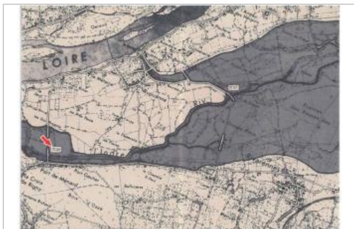
Localisation et altitude du repère (flèche rouge) sur le document d'origine

Code : DDE37_jan82_R_2_1 Date de mise à jour : 12/02/2019 Auteur : SPC LCI