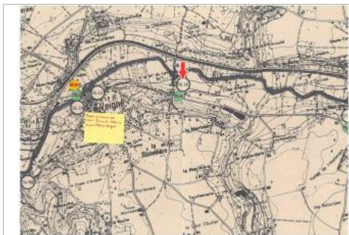
Localisation et altitude du repère (flèche rouge) sur le document d'origine