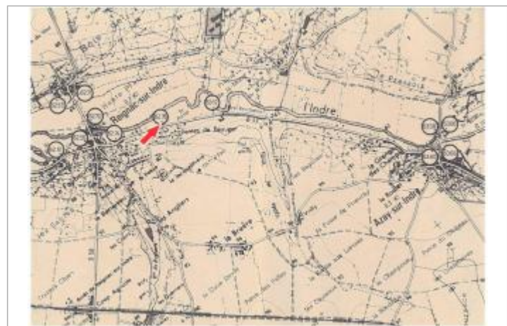
Localisation et altitude du repère (flèche rouge) sur le document d'origine

GÉNÉRAL Code : DDE37_IND85_R_71_1 Date de mise à jour : 20/02/2019 Auteur : SPC LCI