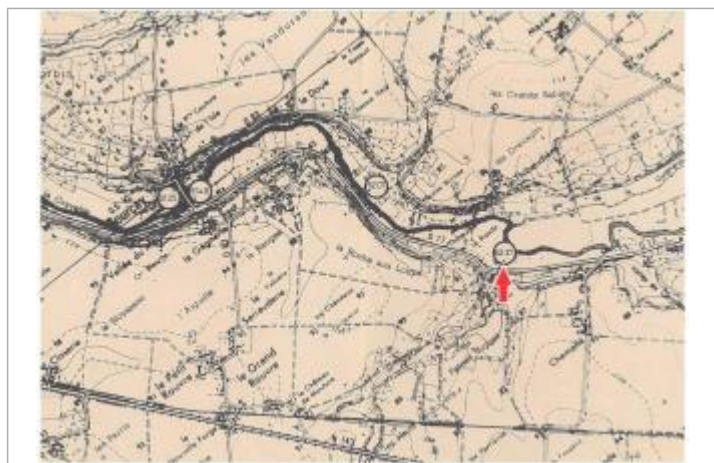
Localisation et altitude du repère (flèche rouge) sur le document d'origine

Code : DDE37_IND85_R_64_1 Date de mise à jour : 15/02/2019 Auteur : SPC LCI