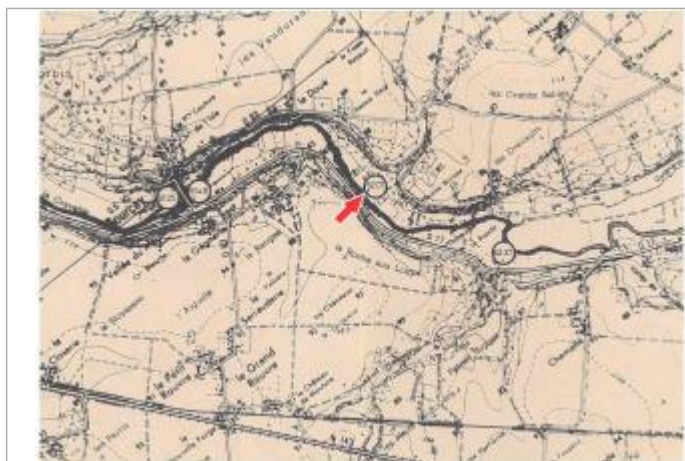
Localisation et altitude du repère (flèche rouge) sur le document d'origine (source : DDE 37)

Code : DDE37_IND85_R_63_1 Date de mise à jour : 21/02/2019 Auteur : SPC LCI