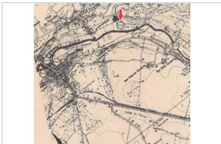
Localisation et altitude du repère (flèche rouge) sur le document d'origine

Code : DDE37_IND85_R_59_1 Date de mise à jour : 21/02/2019 Auteur : SPC LCI