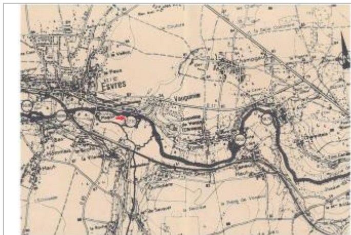
Localisation et altitude du repère (flèche rouge) sur le document d'origine