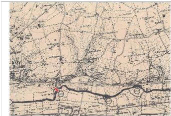
Localisation et altitude du repère (flèche rouge) sur le document d'origine