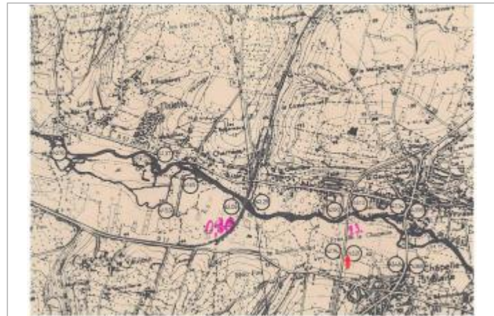
Localisation et altitude du repère (flèche rouge) sur le document d'origine