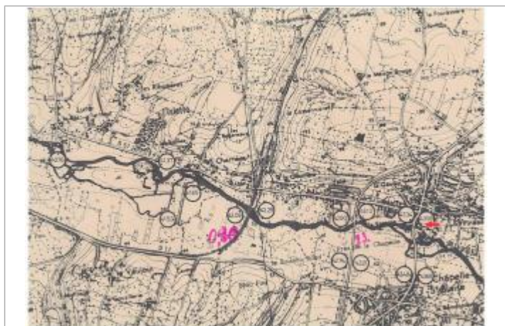
Localisation et altitude du repère (flèche rouge) sur le document d'origine

Code : DDE37_IND85_R_12_1 Date de mise à jour : 20/02/2019 Auteur : SPC LCI