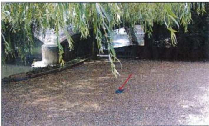
17 Route d'Evreux